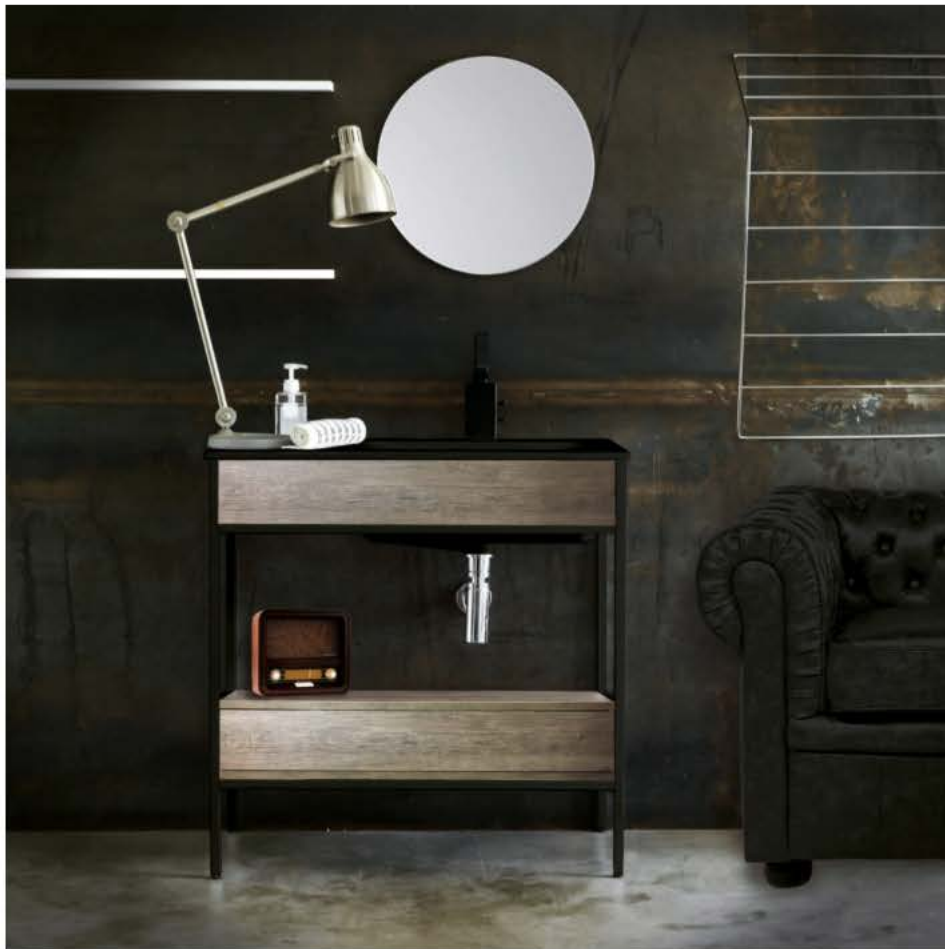
Xilon | Nuovi lavabi d'arredo al Salone del Bagno 2018

Chiudo la carrellatta di novità sui lavabi con una proposta di Xilon (brand che offre diverse proposte per la zona lavanderia / bagno di servizio): Candid. Il modello, già presente a catalogo, è stato reinterpretato in chiave industrial per questo ultimo Salone e incassa un lavabo in ceramica nera nella struttura metallica total black, per adattare la proposta ai nuovi gusti e alle nuove tendenze.